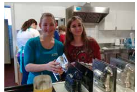
Firmlinge unterstützten die Aktion

Die Jugend unserer Pfarre hat mit Unterstützung von einigen Firmlingen heuer 150 Osterlämmern gebacken und verkauft. Der Gesamterlös durch den Verkauf der Osterlämmern kommt der