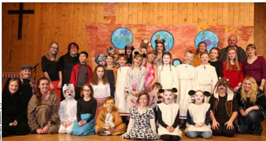
Den Jungscharkindern ist eine sensationelle Aufführung gelungen