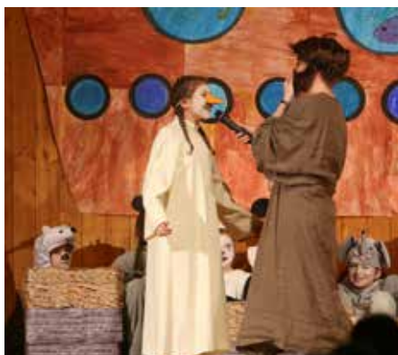
Auch die Taube sorgte für Unterhaltung