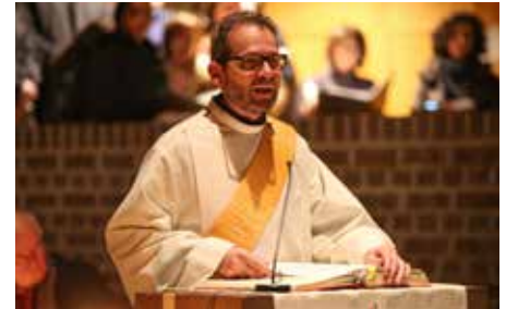
Ansprache in der Osternacht

Von der Segnung der Palmzweige am Palmsonntag über den Kreuzweg zur Todesstunde bis zur Feier der Osternacht und dem Ostergottesdienst.