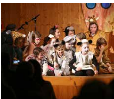
Mehrere Wochen wurde geprobt