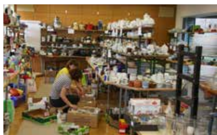
Blick in die Geschirrabteilung