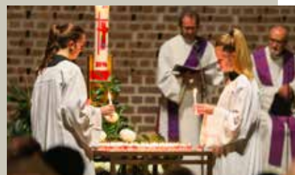
Totengedenken zu Allerseelen

Am 01. November 2016 fand am Welser Friedhof die ökumenische Totengedenkfeier statt. Das Totengedenken für die 55 verstorbenen Pfarrangehörigen folgte zu Allerseelen, am 02. November 2016.