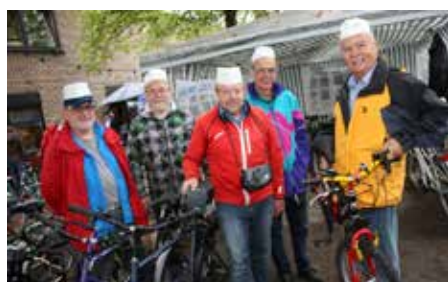
Fahrradabteilung im Innenhof der Pfarre