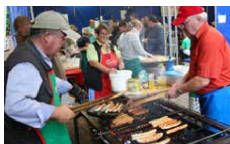
Für das leibliche Wohl war gesorgt