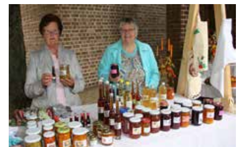
Genussstandmarkt am Kirchenplatz

nicht um mein Brot. Also ist in dieser Bitte auch der Aufruf zum Teilen enthalten, es geht auch um das Wohl des Nächsten. Als Christ kann mir der Hunger des Nachbarn nicht egal sein. Das Brot ist nicht mein Eigentum, weil es von der Erde stammt, die allen gehört. Und wer meint, ihm allein gehöre etwas, hat vergessen wie viel er selbst geschenkt bekommen hat. Wir müssen unsere Lebensgrundlagen so-