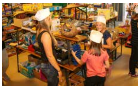
In der Spielzeugabteilung wird gehandelt