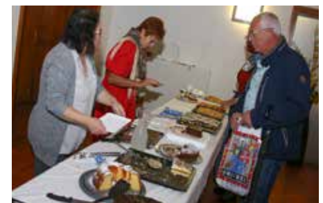
"Mehlspeisen Sonntag" im Pfarrheim

lidarisch und großzügig teilen.“ Nach dem Gottesdienst luden der Genussstandmarkt mit selbstgemachten Köstlichkeiten und der Mehlspeisenverkauf zum Ausklang ins Pfarrstüberl. Der Erlös kommt wiederum der Orgelrenovierung zugute, die nächsten Frühling stattfinden wird.