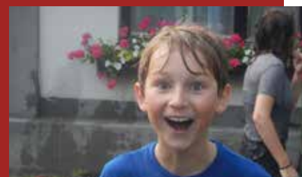
Lustige Wasserschlacht und ...