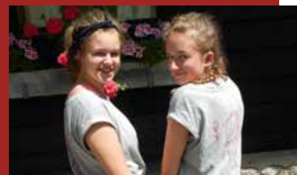
... Erholung bei schönem Wetter

35 Kinder, neun Leiterinnen und Leiter sowie zwei sehr unterstützende Köche genossen in der ersten Ferienwoche das Pfarrlager auf der wunderschönen Niglalm.