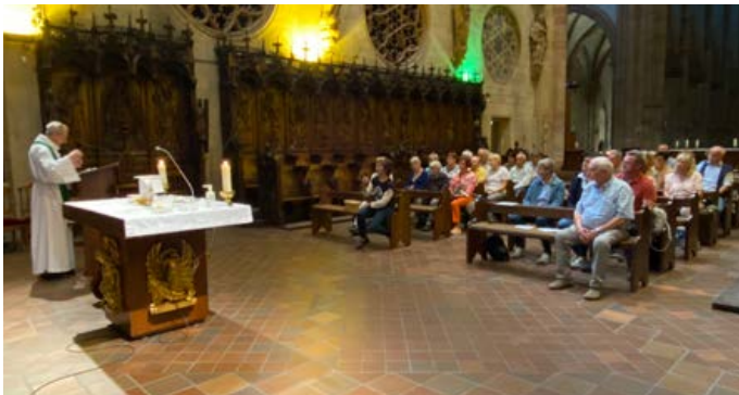
Stiftskirche St. Martin in Colmar