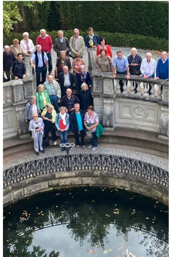
Donauquelle in Donaueschingen