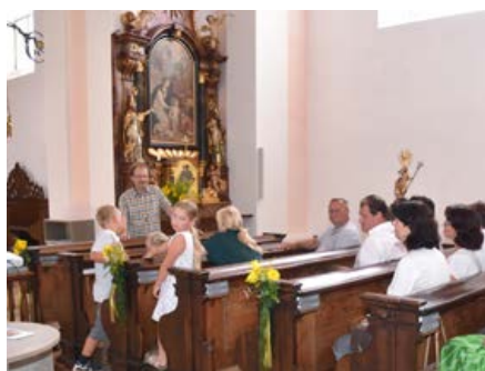
Seite 2: Pfarrfest 2024