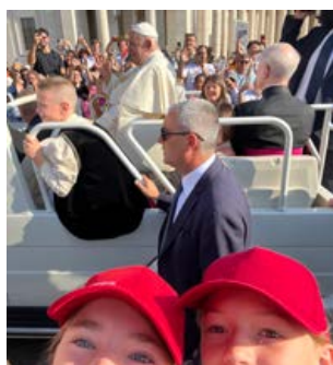
Seite 6: Mini-Wallfahrt