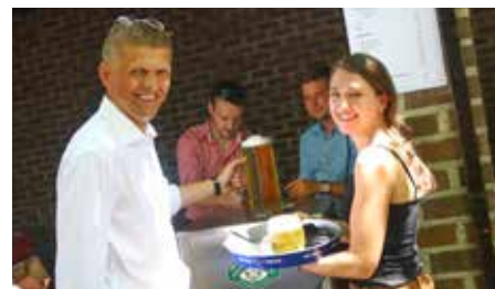
Ein kühler Schluck Bier für die Musiker

pens an gekühltem Bier vom Fass, Köstlichkeiten vom Grill und hausgemachten Kuchen und Torten. Musikalisch war mit den „Mühlbach Buam“ für beste Unterhaltung gesorgt.