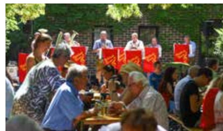
Musikalischer und kulinarischer Genuss im Innenhof

Nach der Segnung der Paare und dem feierlichen Gottesdienst, begleitet von einer Bläsergruppe, fand im Innenhof der Pfarre der Frühschoppen statt. Bei hochsommerlichen Temperaturen erfreuten sich die Gäste des Frühschop-