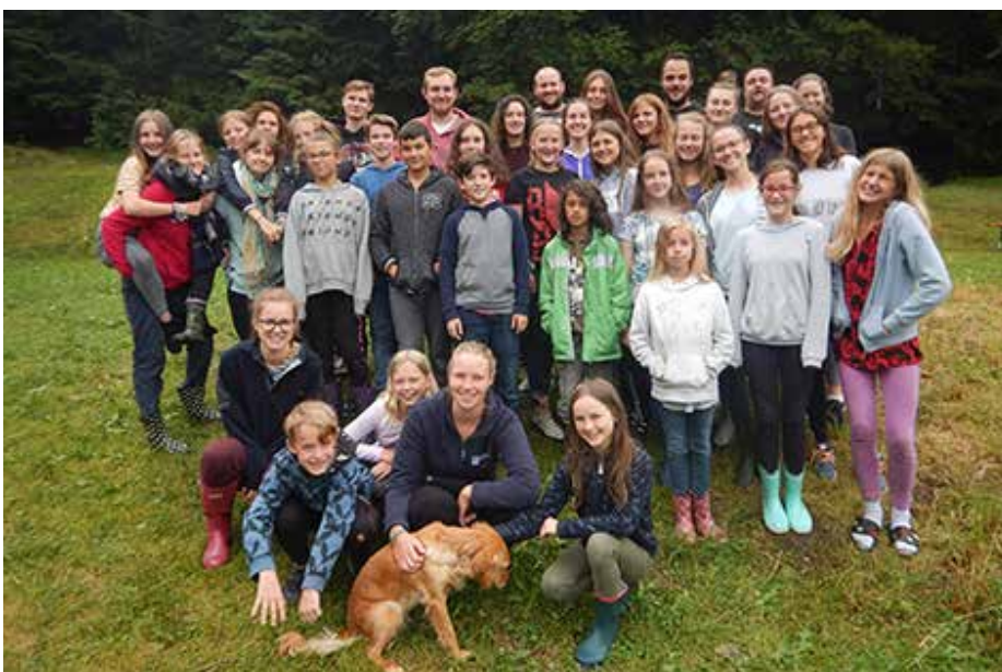
Die Jungscharkinder und MinistrantInnen unserer Pfarre

Am Donnerstag feierten sie mit Pfarrassistent Andreas Hasibeder einen Lagergottesdienst, der unter dem Thema „Superhelden im Alltag“ stand. Die Kinder hatten Lieder, Fürbitten und ein Theaterstück vorbereitet. Abends wanderten unsere mutigen Superhelden im Dunkeln durch den Wald, um abermals Stationen zu absolvieren. Zum Abschluss fand ein bunter Abend statt, an dem das bis dahin gehütete Geheimnis des gesuchten Bösewichts gelüftet wurde.